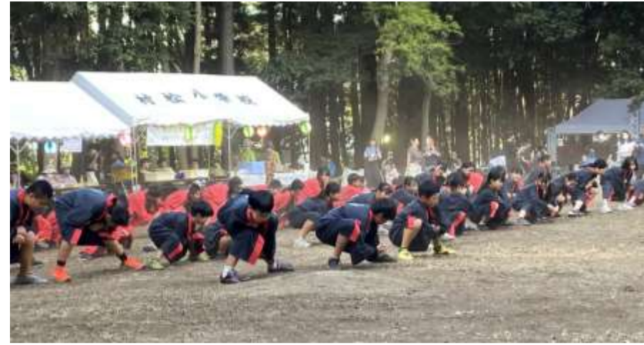
行灯の明かりの下に集って演奏や踊りを 楽しみ、みんなで夏の一夜を満喫