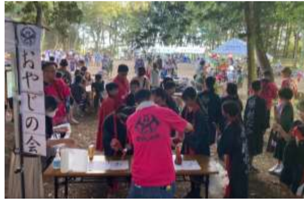
やきとり、焼きそば、かき氷、カレーにフランクフルト、 赤飯やとうもろこしも。お腹いっぱいになりますよ♪