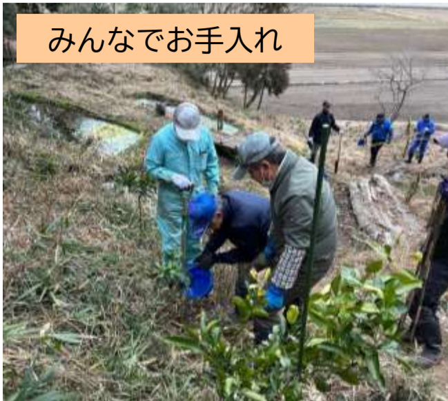
みんなでお手入れ