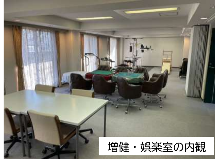
増健・娯楽室の内観

どちらも多目的に使用でき、安らぎの場や親睦の場として皆さんの利用をお待ちしています。