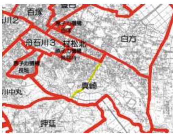
自治会のおおよその区割り (東海村HPより)